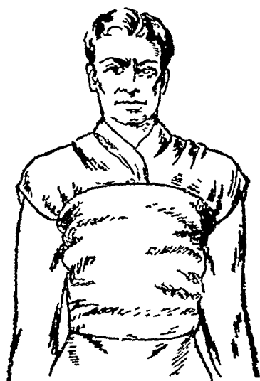
सीने की लपेट